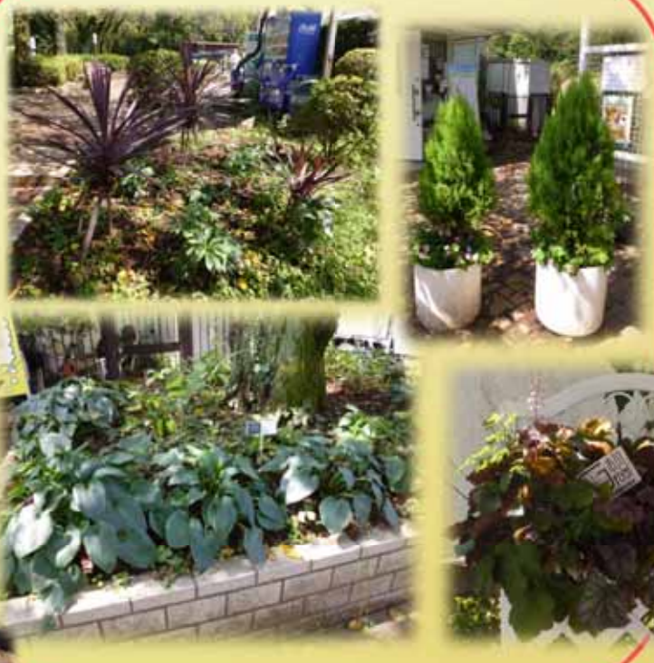
クリスマスローズ コルジリネ