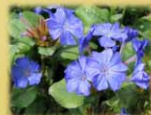
コニファー ルリマツリモドキ