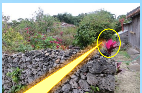
レッドエッジ (幸福の木)