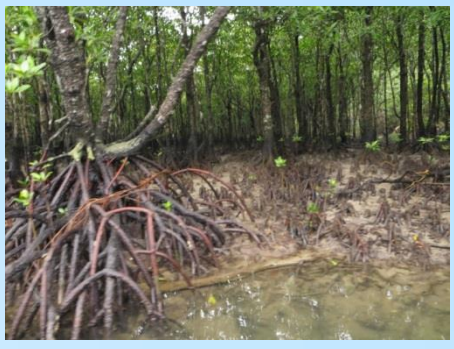
マングローブの森

お正月に訪れた離島では、 パンジーやハボタンを 見かけることはありませんでした 1月の寒い時期、市川では 家の中で育てている観葉植物が 暖かい沖縄では 普通に路地に植えられています 園芸を楽しむために 原産地を知るといふことは 植物を育てる第1歩です