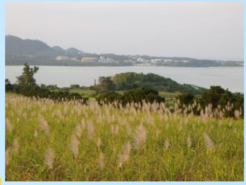
収穫間近のさとうきび