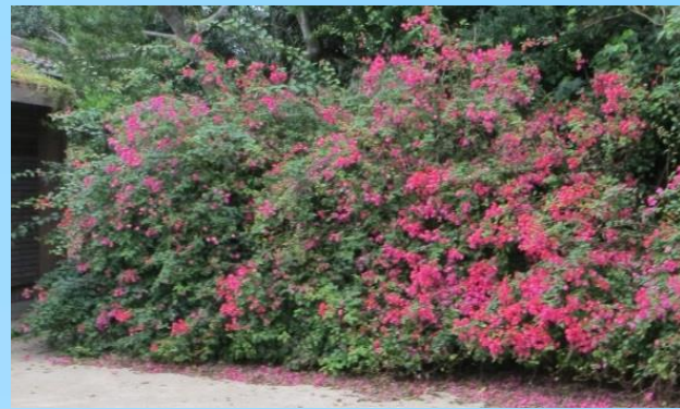
ブーゲンビレアの生垣