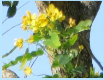
マメ科モクセンナ