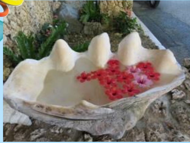
ハイビスカスを用いた素敵な演出