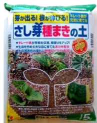
ふかふかで発芽しやすい用土