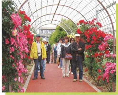
ボランティアの活躍で見事なバラのトンネルに